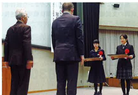
最優秀者に表彰状を授与

最優秀のお二人のほか、中学・高校それぞれ2編の優秀作品を含む6名の方々に、山形県警察本部長と公益社団法人やまがた被害者支援センター理事長連名の表彰が行われました。最優秀の2作品は全国作文コンクールに応募しています。