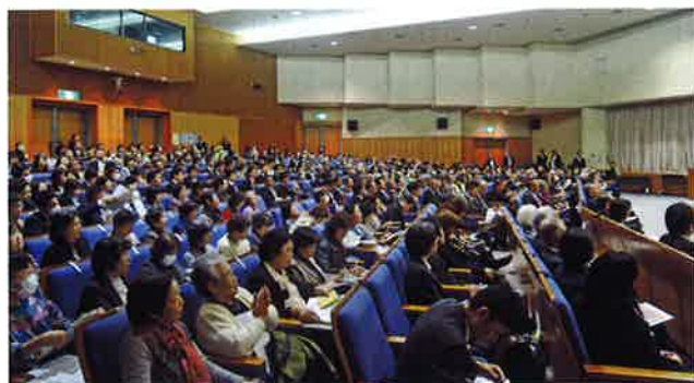
定員400名の会場に約450名の参加者の方々が聴講