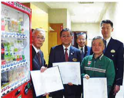
市町村では2例目の小国町役場に設置