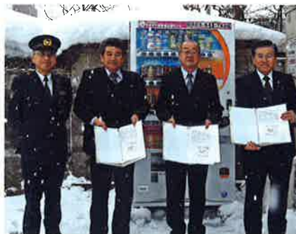
新庄信用金庫にも設置