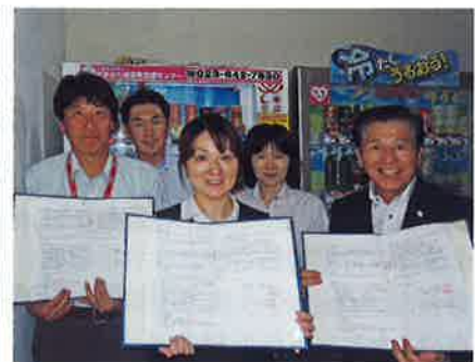
食糧会館でもご協力