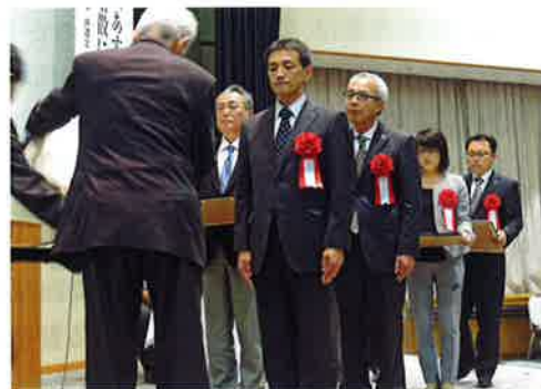
支援事業所等に感謝状を贈呈